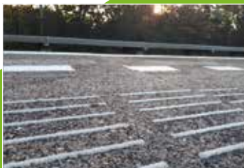
Den Helder opgehaald perron

In het najaar van 2018 was station Zutphen aan de beurt tijdens een lange buitendienststelling van 76 uur. Tijdens onze werkzaamheden was maar één spoor buiten dienst om de doorstroming niet teveel te verminderen. Het spoor ernaast was gewoon in gebruik. Om hier een veilige werkplek te creëren is eerst een Safety Fence tussen de sporen geplaatst. Vervolgens is ook de perronoutillage verwijderd en daarna werd de asfaltverharding van het perron verwijderd. Na het stellen van de randkist, dilatatieprofielen en het aanbrengen van de wapening lag het klaar om het beton te storten. Na het uitharden zijn de markeringen en de perronoutillage weer aangebracht en is het Safety Fence verwijderd.