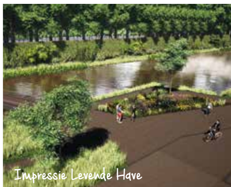
Impressie Levende Have

Tot slot heeft Krinkels opdracht gekregen om twee proefmodellen te bouwen in de Mock-up tuin van het project Zuidelijke Ringweg Groningen. Wellicht een opstap naar een heel groot werk van ca. 30.000 m2 groene geluidsschermen op basis van het KGS principe ontwerp 'Sound-killer'.