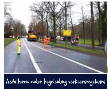
Asfalteren onder begeleiding verkeersregelaars