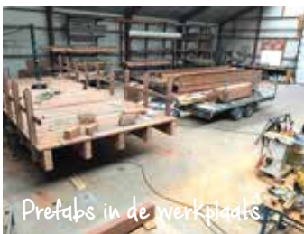
Prefabs in de werkplaats