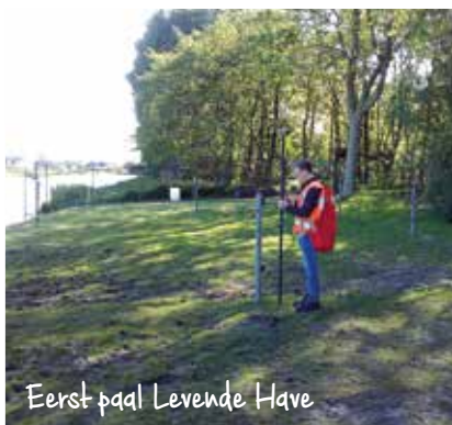
Eerst paal Levende Have