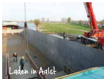
Laden in Aalst