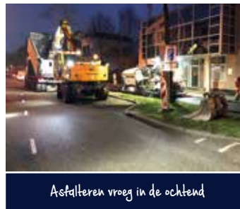
Asfalteren vroeg in de ochtend