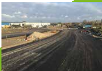
Zuidhoornseweg in aanleg

Het eindresultaat is iets om trots op te zijn. Van Ooijen Gouda heeft het project naar volle tevredenheid van de klant binnen de gestelde tijd gerealiseerd.