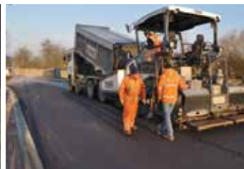
Weekend twee, aansluiting bij A4