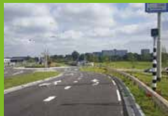
Zuidhoornseweg met rotonde (nieuwe situatie)