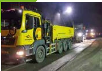
Weekend één, frezen van het wegdek A4